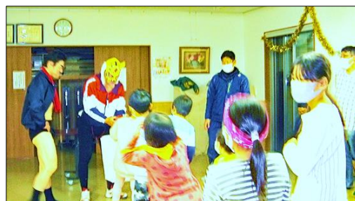
昨年のクリスマス会

「みどり子ども会」はさくら小学校区内の小学生を対象とした誰もが入れる子ども会です。歓迎会、ジャガイモ・さつま芋堀、団地祭に参加、夏のお泊り会、地域運動会、クリスマス会、かるた取り、節分等行い「学年をこえて仲良く楽しく遊び、学習や社会見学、奉仕活動を通じ、強く・明るい子どもになるよう努力」することを目的に活動しています。会員の保護者で構成する育成会は「子ども会の健全な運営を助け子どもの好ましい人間形成につとめると共に、会員相互の研修・親睦を図ることを目的」にして活動をおこなっており、保護者の皆様にご負担の無いよう運営に努めております。1年生の皆様や新入生以外の方も子ども会に入会してみませんか。不明な点やお申込み手続きは、子ども会役員までご連絡ください。