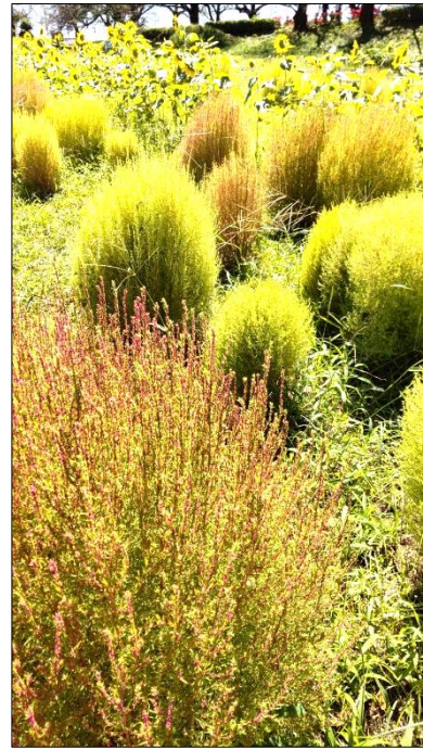
権現堂堤の彼岸花とコキア 2021.9.20 撮影