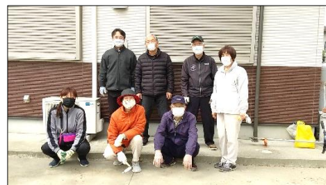
4区、参加者のみなさま (自治会館前で)