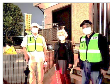
4/26、3区の防犯パトロールメンバー

班長割り当て表にこだわることなく、時間的に余裕がありましたら積極的な参加をお願い致します。また、班長以外でもご協力していただける方がいらっしゃいましたら、3区区長までお問い合わせください。よろしくお願ひ致します。