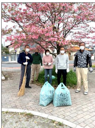
2区3区、中央公園の清掃を終えて

4月17日、久しぶりに全区そろってクリーン作戦が実施されました。天気も良く、みなさまの協力でより過ごしやすい公園になりました。参加者は1区7名、2区3区9名、4区7名でした。今後ともご協力よろしくお願ひします。