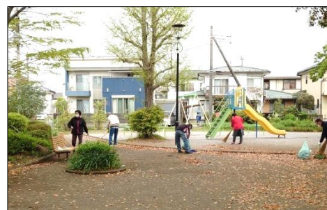
1区、緑台公園での清掃の様子