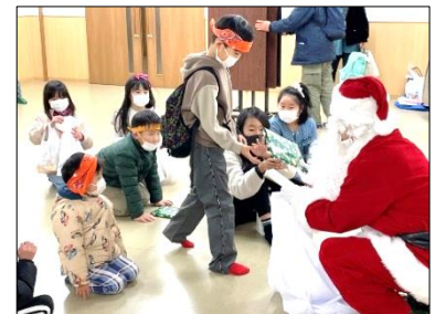
昨年のクリスマス会