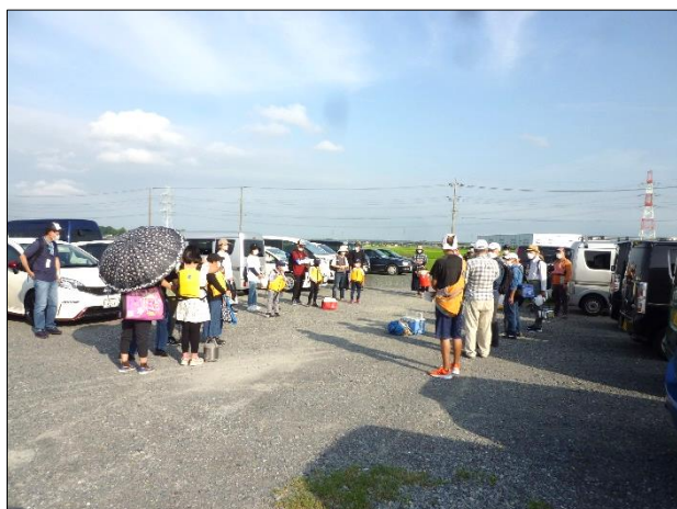
神扇池前に集合 会長から注意事項の説明

「へラブナ釣り体験」に関わってくださった釣り場の管理事務所スタッフの皆さま、釣り愛好家のインストラクターの皆さま、自治会会員有志の皆さま、ご協力ありがとうございました。子どもたちの感想などは次号以降で掲載する予定です。