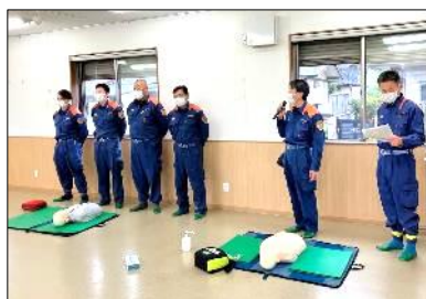
消防署から心肺蘇生、AED 体験説明