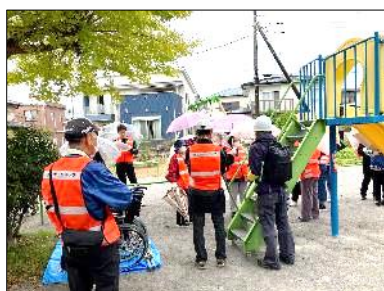
各区 集合場所に集合, 人数確認

訓練終了後、幸手市危機管理防災課から「洪水に対するハザードマップの見方」についての説明を聴き、午前中で訓練を終了しました。