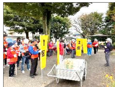
中央公園に全区集合