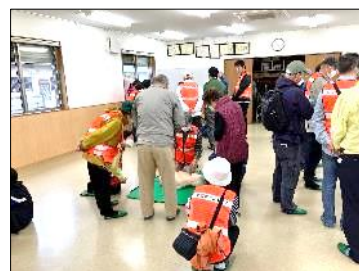
心肺蘇生など会員が体験