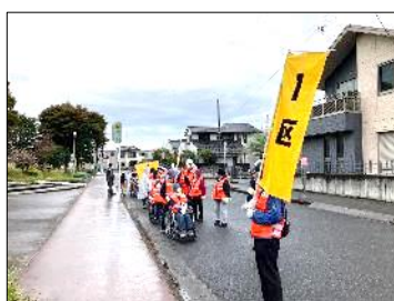
避難訓練(ウェルス幸手へ出発)