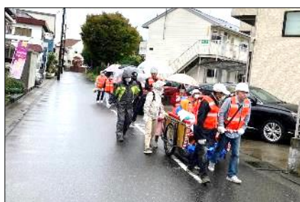
集合場所から中央公園へ移動