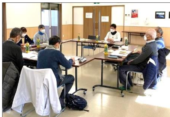
2/24 民生委員・児童委員との懇談会

2024年2月24日（土）午前、地区の民生委員・児童委員（以下民生委員と略す）2名と自治会の役員5名が参加し懇談会を行いました。前回2023年3月の懇談会から、約1年ぶりの開催でした。懇談会は自由な意見交換の形で行いました。結果について、概略下記の通りです。